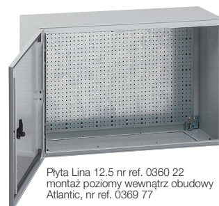
Płyta Lina 12.5 nr ref. 0360 22 montaż poziomy wewnątrz obudowy Atlantic, nr ref. 0369 77

Tabela doboru obudów i wyposażenia str. 504–505 Dane techniczne str. 517