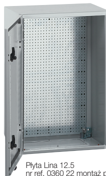
Płyta Lina 12.5 nr ref. 0360 22 montaż pionowy wewnątrz obudowy Atlantic nr ref. 0369 26